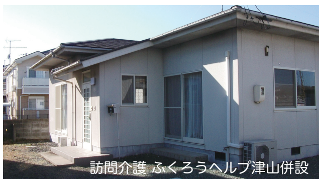
訪問介護 ふくろうヘルプ津山併設

グーグルかヤフーで「なんでもふくろう」又は「ふくろうヘルプ」で検索。 一発で検索できます。